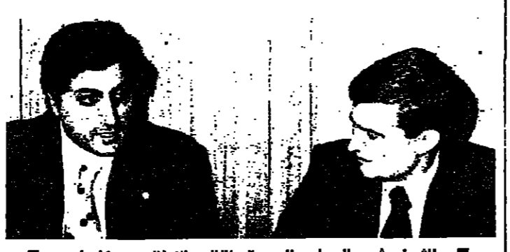
الشيخ بشير الجبل والى جنبه نائب ايطالي دو كاروليس

قال النائب ايطالي مكسيبو دو كاروليس ، في مؤتمر صحفي عقده في الثالثة من بعد ظهر امس ، في مقر المجلس العربي اللبناني ، انه جاء الى لبنان في زيارة استطلاعية لتتد الاوضاع ، والوقوف على حقائق الاحداث التي جرت منذ بداية الحرب . وقال دو كاروليس ، وهو نائب من ميلانو ويعتبر عضوا بارزا في الحزب الديمقراطي المسيحي ، انه سيجعل بعد عوفته الى بلد على شرح القضية اللبنانية كما يدعو الى مزيد من التضام بين الحزاب اللبنانية اجراءات تنسيق . وستقوم دو كاروليس ، الذي قابل رئيس القابن قبل ظهر امس ، بلقاء مباحثات اخرى مع حزب الوطينيين الاحرار ، على صعيد التنسيق القائم بين الحركات والحزاب العمالية للشبيوية في العالم . هذا ويستمر الاتصالات من اجل المزيد من الاتفاقيات بين الحزاب اللبنانية في العالم لواجهة الحزاب الاخرى .